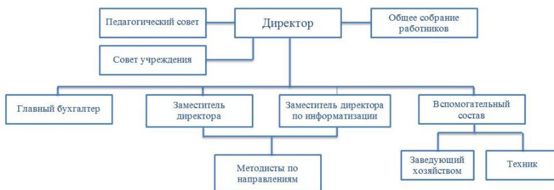
СТРУКТУРА УПРАВЛЕНИЯ МБУ ДПО «ЦЕНТР ОБЕСПЕЧЕНИЯ РАЗВИТИЯ ОБРАЗОВАНИЯ»

Многоуровневая система методической службы Ангарского городского округа представлена традиционной структурой (муниципальные методические объединения педагогов по предметам и направления) и сетевой многовекторной структурой (опорные, базовые образовательные учреждения, ресурсные, учебно-методические центры, стажировочные, опорные сетевые, партнерские проекты, педагогические площадки на