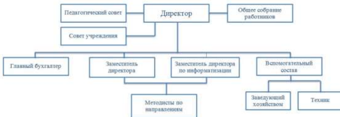
СТРУКТУРА УПРАВЛЕНИЯ МБУ ДПО «ЦЕНТР ОБЕСПЕЧЕНИЯ РАЗВИТИЯ ОБРАЗОВАНИЯ»

Согласно пункту 3 ст. 26 Федерального закона от 26.12.2012 № 273-ФЗ «Об образовании в Российской Федерации», единоличным исполнительным органом учреждения является директор. Штатным расписанием МБУ ДПО ЦОРО предусмотрены заместитель директора по УВР, заместитель директора, заместитель директора по информатизации, главный бухгалтер, которые осуществляют управление по соответствующим направлениям.